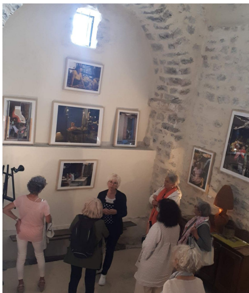
Inauguration de l'exposition